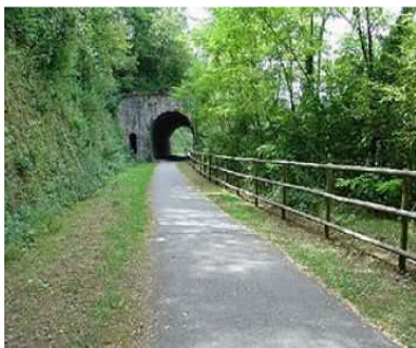
Un dels trams de la Via Verda

L'associació que defensa la Via Verda del Vallès reclama a la Generalitat que faci efectius els quatre milions d'euros promesos per finançar la construcció d'aquesta infraestructura. De moment només hi ha dos trams creats, els que corresponen a Sant Quirze i Cerdanyola. El tram de Rubí està en construcció, i el de Sant Cugat, que ha de resseguir el Vial Interpolar, encara no s'ha començat.